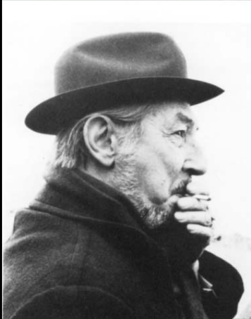
Carlo Scarpa (1906-1978)