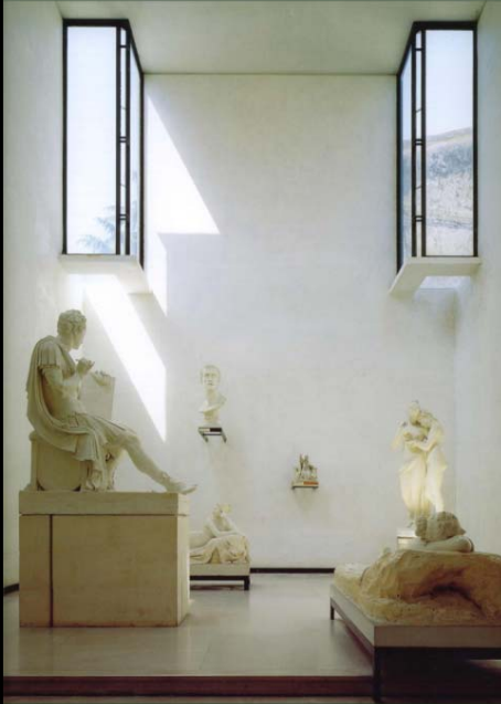
Carlo Scarpa: Gipsoteca Canoviana (a Canova Múzeum bővítése), Possagno, 1955-1957